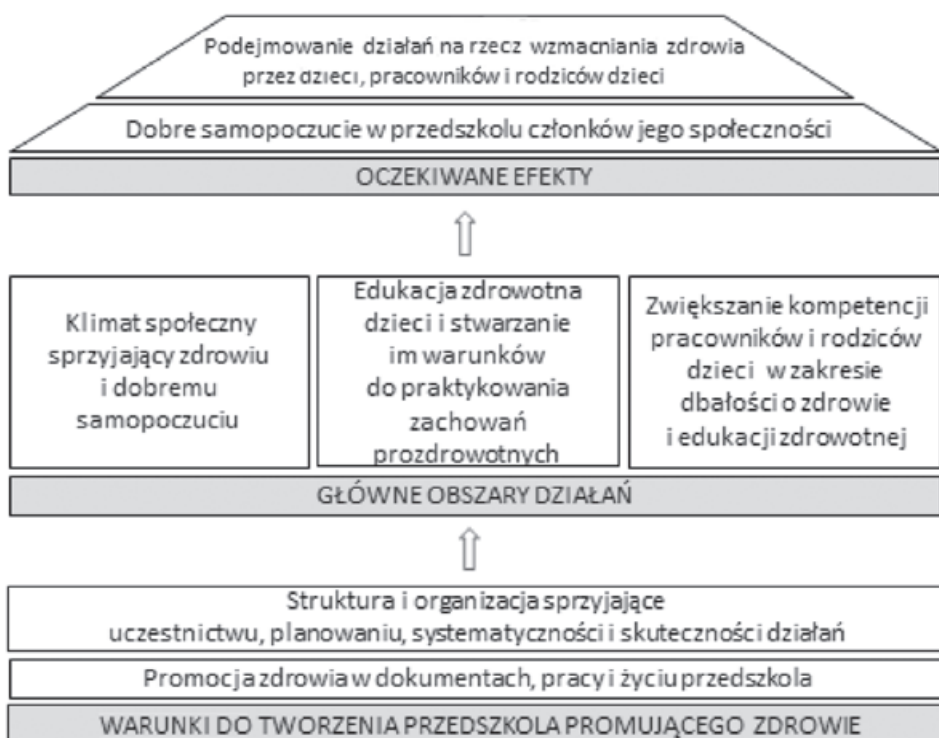
Ryc. 1. Model przedszkola promującego zdrowie w Polsce. Źródło: Woynarowska-Sołdan, Woynarowska, 2017, s. 19

W modelu PPZ, przedstawionym na ryc. 1, uwzględniono, podobnie jak w SzPZ, trzy poziomy: poziom najniższy — warunki dla tworzenia PPZ; poziom środkowy — trzy główne obszary działań (klimat społeczny sprzyjający zdrowiu i dobremu samopoczuciu, edukacja zdrowotna, zwiększanie kompetencji pracowników i rodziców w zakresie dbałości o zdrowie); poziom najwyższy — oczekiwane efekty, nawiązujące do definicji PPZ.